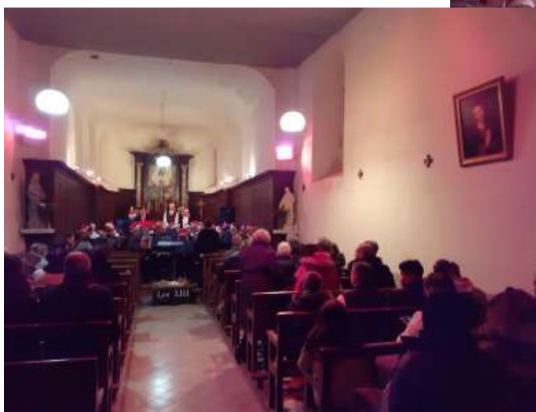
L'orchestre les XIII de Fromentières a réussi à tenir dans le chœur de l'Eglise !